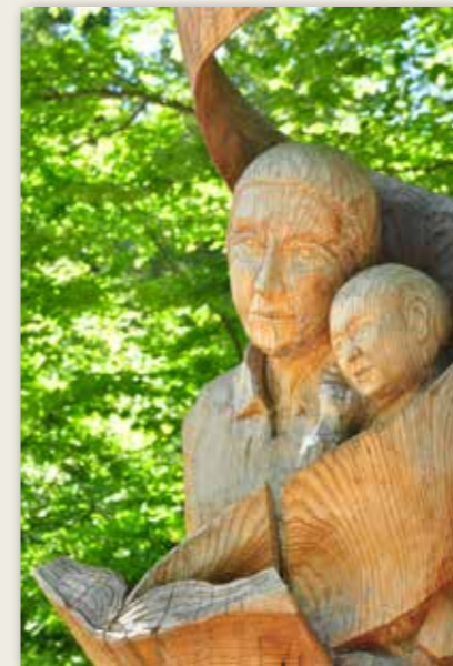
La storia dei “fasoleti” The story of “fasoleti” / Die Geschichte der “fasoleti”