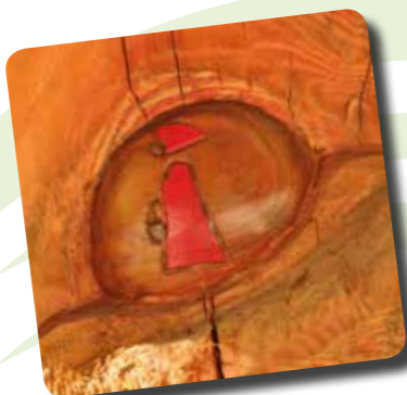
Cappuccetto Rosso Little Red Riding Hood / Rotkäppchen

Ingresso libero / Free admission / Freier Eintritt