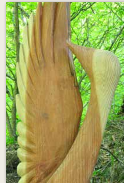
Il Brutto Anataroccolo The ugly duckling / Das hässliche Entlein