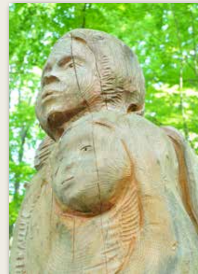
Hansel e Gretel Hänsel and Gretel / Hänsel und Gretel