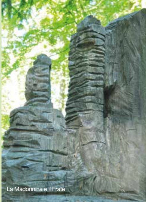
La Madonnina e il Frate