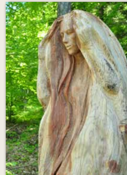
Raperonzolo Rapunzel / Rapunzel